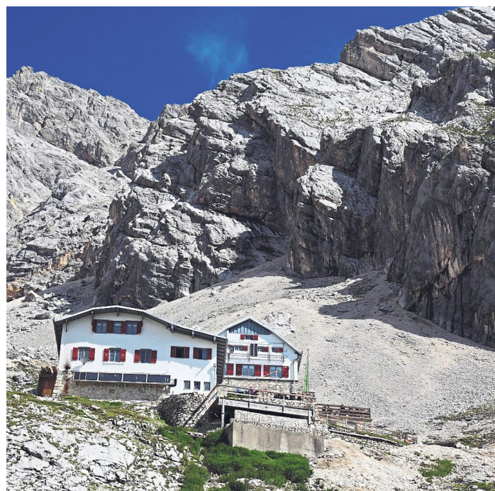
Eine von den gefragten Übernachtungsmöglichkeiten: Die Knorrhütte des Deutschen Alpenvereins im Wettersteingebirge.