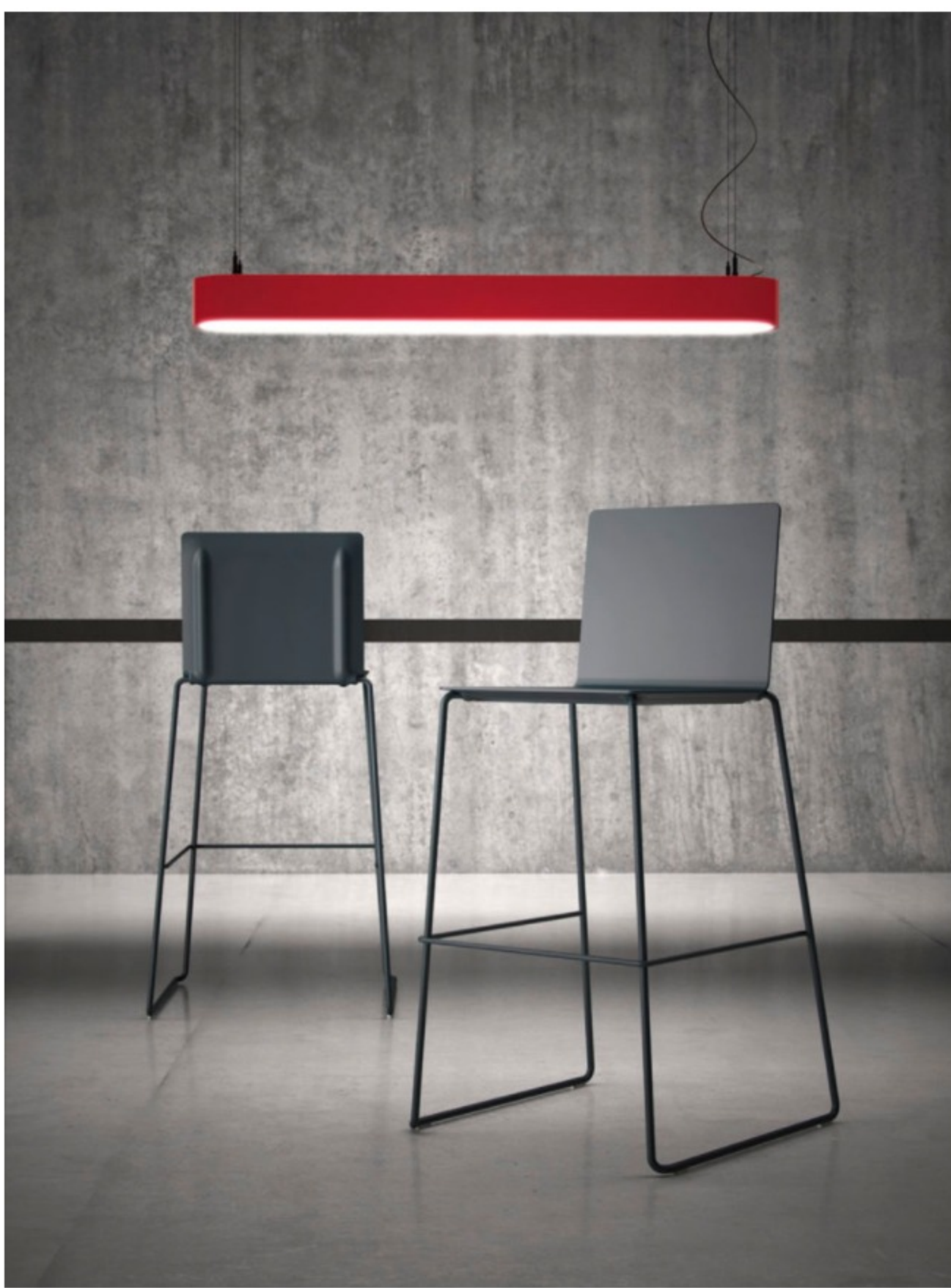
Schaut über die Tischkante: Barhocker „Mood“ mit ergonomisch geformter Sitzschale auf einem Metallgestell.