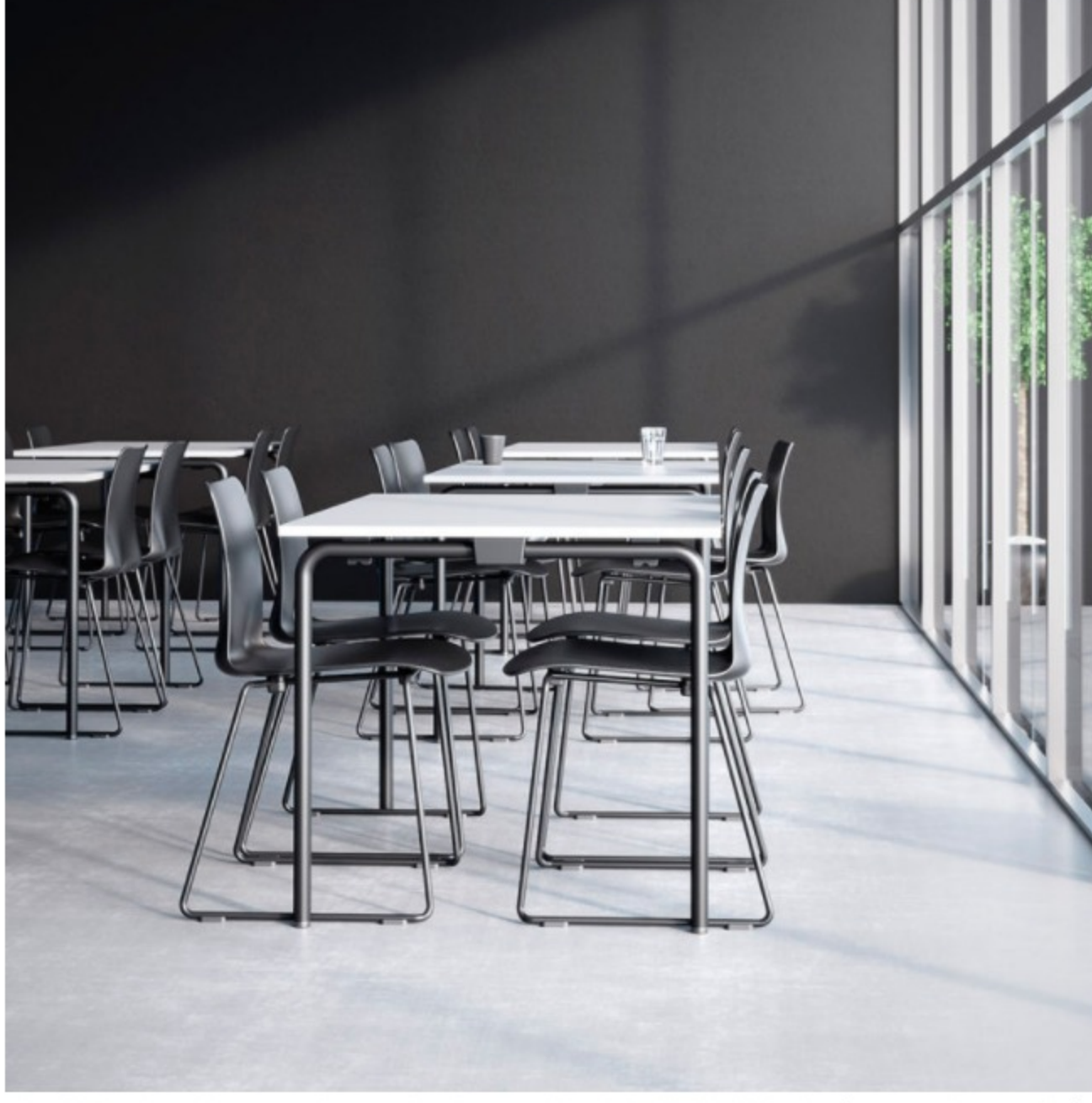
Klappstisch „Tube Fold“ von Randers + Radius, in Deutschland erhältlich bei böhmier.