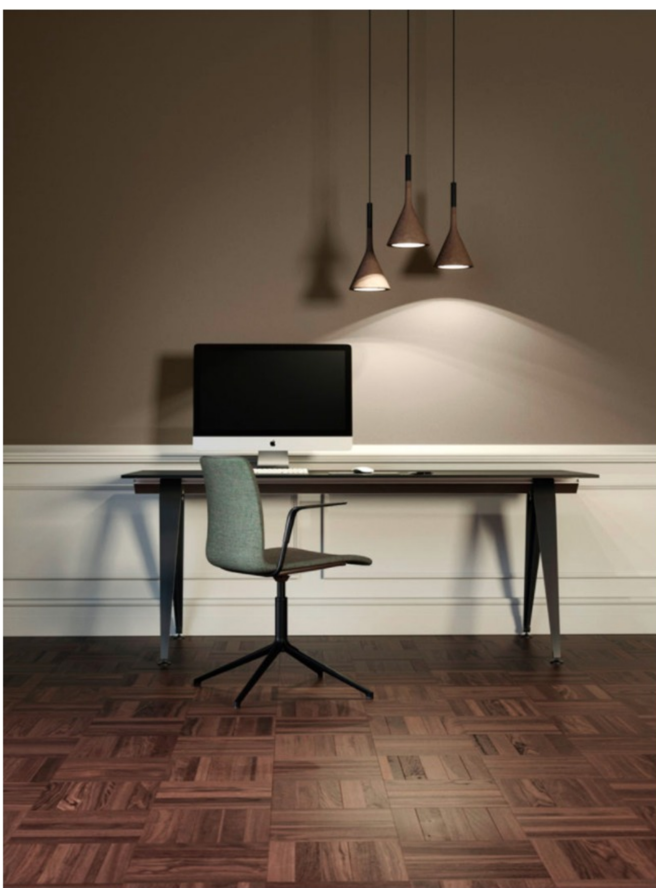
Drehstuhl aus der Kollektion „Mood“ von Hans Thyge &amp; Co für Randers + Radius.