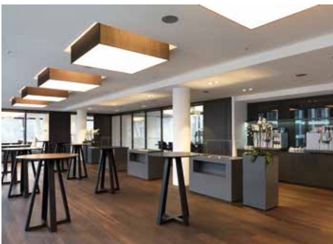
Der Showroom von böhmler Büro und Objekt: moderne Arbeitswelten auf 750 qm Ausstellungsfläche