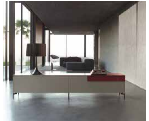
Qualität und Design, die international überzeugen: ROLF BENZ und PIURE produzieren „Made in Germany“