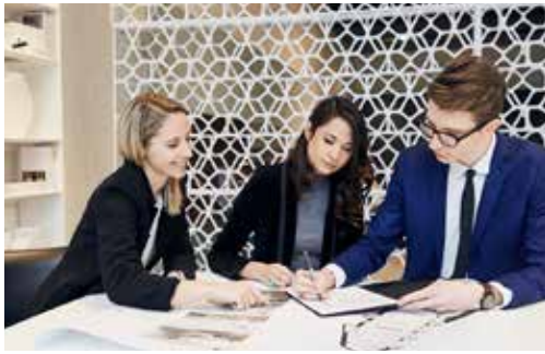
Das Interior Design Solutions-Team berät von der Idee bis zur Realisierung kompletter Wohnkonzepte.