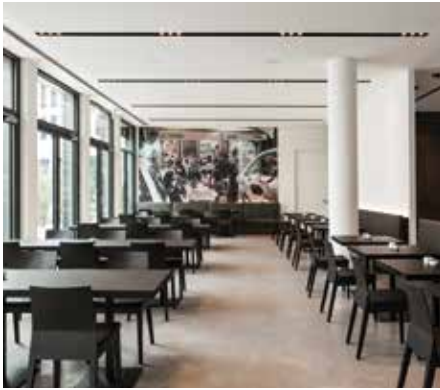
böhmler Büro und Objekt realisiert Gesamtkonzeptionen für professionelle Konferenz- und Arbeitsplätze.