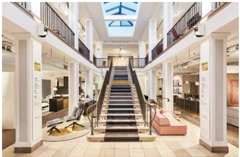
Internationales Wohngefühl auf über 3.000 qm