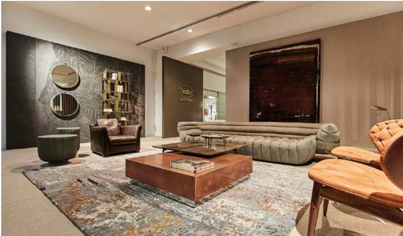
Exquisite Wohnwelt: die Baxter Area bei böhmeler