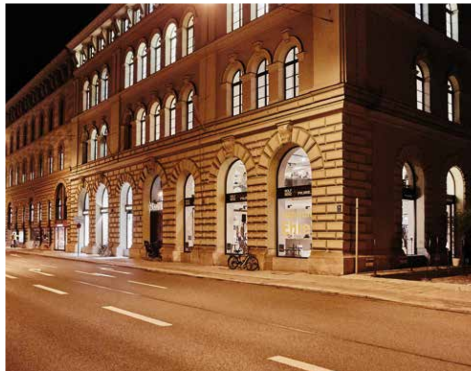
Der ROLF BENZ + PIURE. by böhmeler Store im Münchener Ludwigpalais