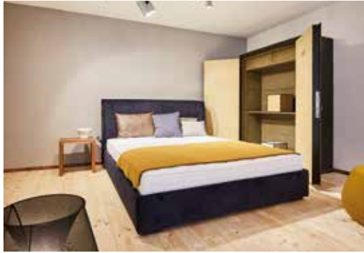
Riposana Betten: perfekte Schlafqualität made in Germany