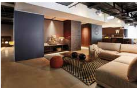
böhmeler: namhafte Designermarken, erstklassige Qualität und individueller Service