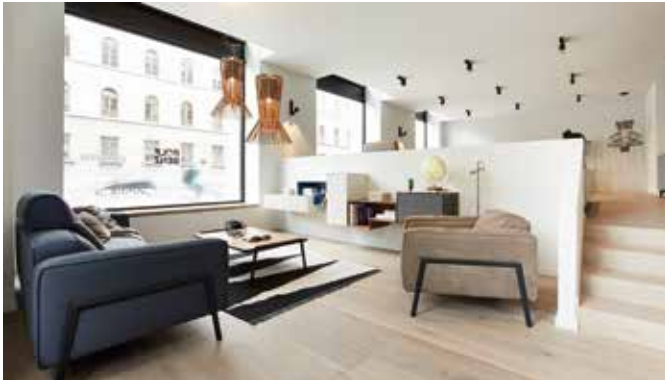
Komplett modernisiert: ROLF BENZ+ PIURE Store im Ludwigpalais