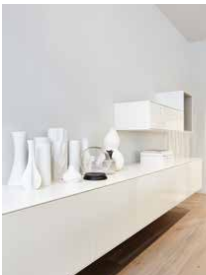
Feinsinnig, pur und spannendvoll: die Designs des Münchener Möbelherstellers PIURE