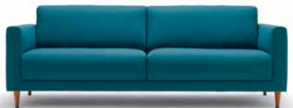
Das freistil 141 bietet große Gestaltungsfreiheit.