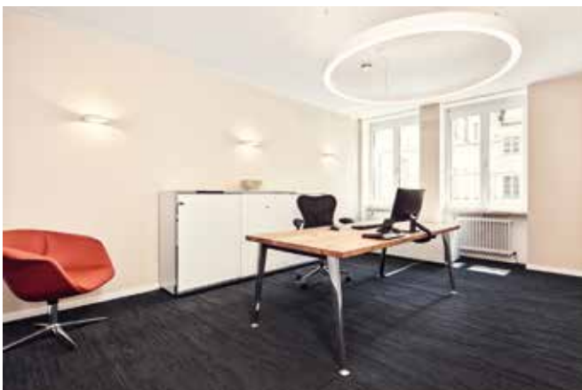
Nachhaltige Produktqualität: Büroraum bei böhmeler