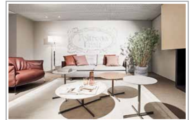
Gerade eröffnet: Die neue Suite von Poltrona Frau im Untergeschoss