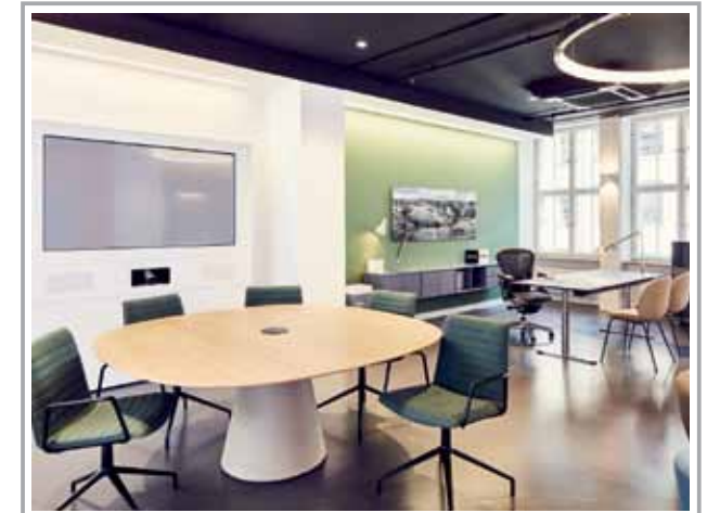
böhmeler Büro und Objekt: Moderne Arbeitswelten auf über 750 qm Ausstellungsfläche