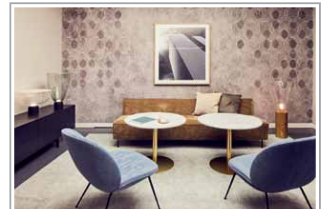
Der Showroom von böhmeler Büro und Objekt im zweiten Obergeschoss