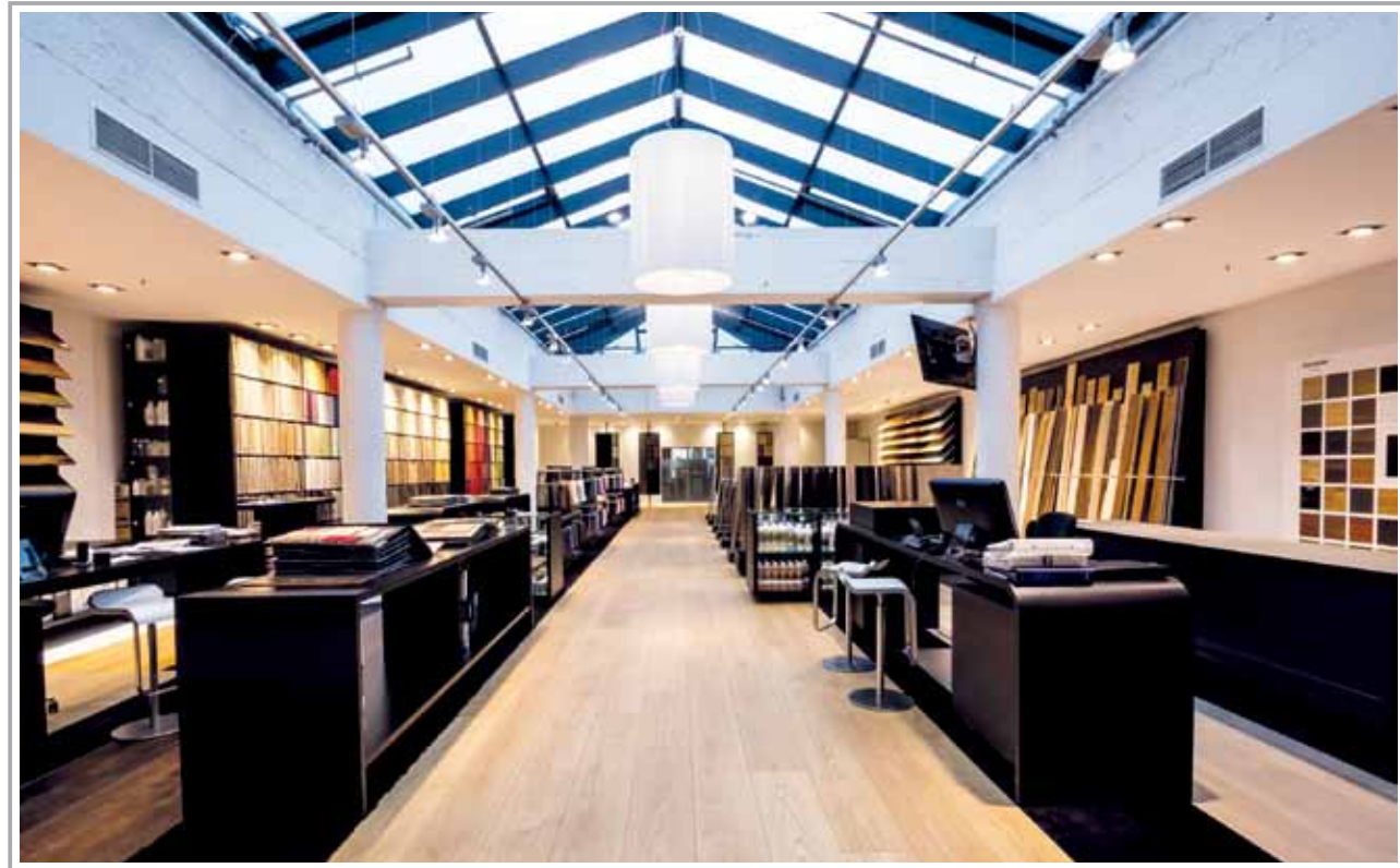
Im Showroom von böhmeler Bodenbelag und Parkett im ersten Obergeschoss des Münchener Haupthauses können sich Kunden persönlich über Trends und Produkte informieren