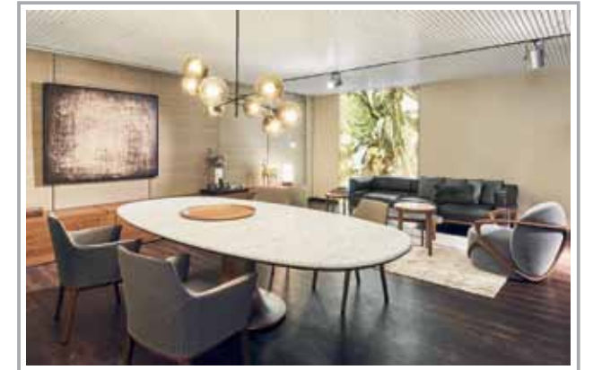
Exquisit kuratierte Wohnwelten: Die Giorgetti Suite im Untergeschoss