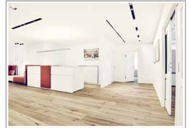
Die Büroräume des neuen Geschäftsbereichs böhmeler Innenausbau im vierten Obergeschoss des Haupthauses im Tal

Mehr Informationen unter: www.boehmler.de