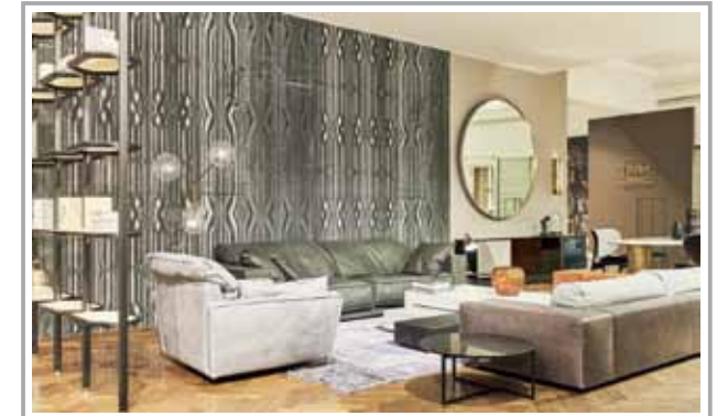
Italienische Eleganz: Die Baxter Area im Erdgeschoss