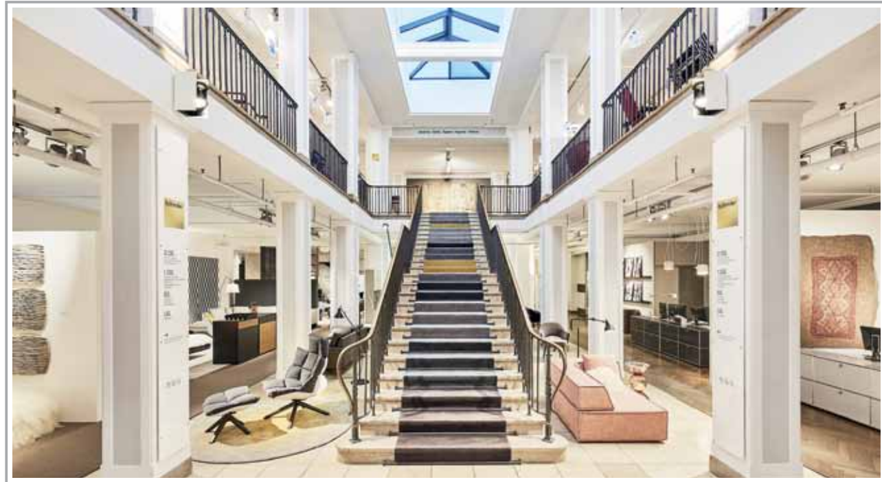
böhmeler: erste Adresse für Designmöbel in München

Im Herzen von München unweit des Viktualienmarktes bietet das Einrichtungshaus böhmeler auf über 3.000 qm Ausstellungsfläche höchste Design- und Produktkompetenz sowie absoluten Premium-Service für alle Bereiche des Wohnens und Arbeitens. Schon vor über 140 Jahren konnte sich böhmeler als Experte für Einrichtung und Bodenbeläge positionieren und gilt heute weit über die bayerischen Grenzen hinaus als erste Adresse für exklusive Designmöbel, komplette Interior-Konzepte, erstklassige Bodenbelags- und Parkettarbeiten, moderne Büro- und Objekteinrichtungen sowie professionellen Innenausbau. böhmeler bietet alle Kompetenzen unter einem Dach. Erfahrene Innenarchitekten und Experten entwickeln individuelle Planungs- und Einrichtungskonzepte für Privat- und Geschäftskunden.